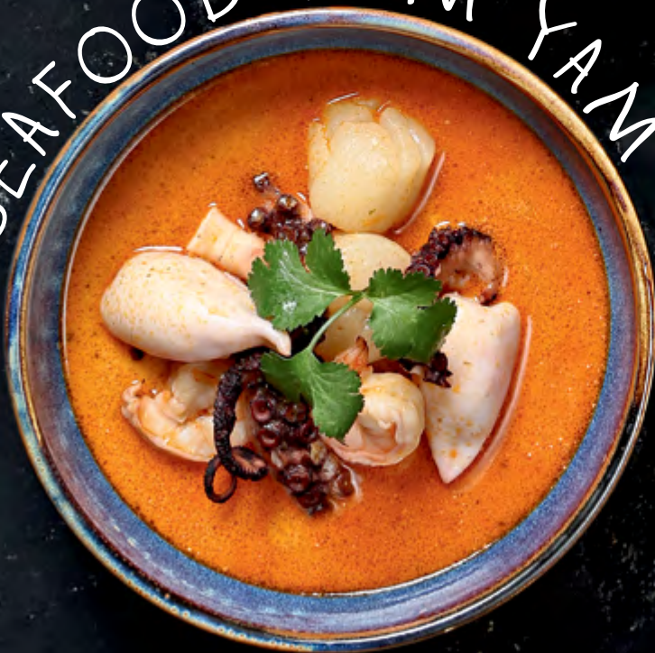
SEAFOOD TOM YAM