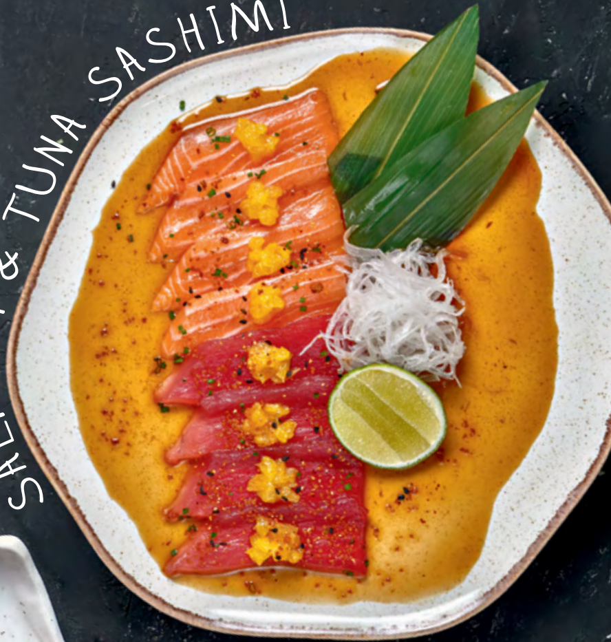
SALMON & TUNA SASHIMI

● САШИМИ из лосося & тунца соус понзу, апельсин & кунжут кимчи